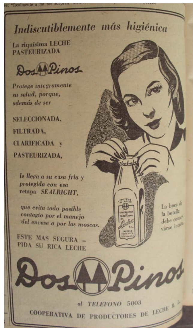
La Nación , 12 de junio de 1952,p.8