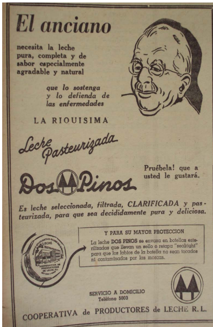
La Nación , 17 de mayo de 1952,p.6